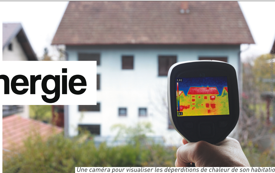
Une caméra pour visualiser les déperditions de chaleur de son habitation