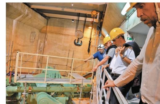
Salle de commande de l'usine de Pied de Borne